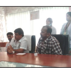
ಶಿಶು ನಿರ್ವಹಣೆಗೆ ವರ್ಷ ವಾರ್ಷಿಕ 27 ಲಕ್ಷ ರೂ. ವೆಚ್ಚಗೊಳಿಸಿ ಬೆಂಚ್. ಎಲ್ಲಕ್ಕೂ ಮುಖ್ಯವಾಗಿ 65 ಲಕ್ಷ ರೂ. ವೆಚ್ಚದಲ್ಲಿ ಹೈಟೆಕ್ ಮತ್ತು ಅತ್ಯಾಧುನಿಕ ಯಂತ್ರೋಪಕರಣಗಳನ್ನು ಪ್ರಯೋಗಾಲಯ ಪ್ರಾರಂಭಿಸಿ ಬೆಳೆಸಿ.

ಪ್ರಜೋದಯ ವರದಿ ಹೊಳೆನರಸೀಪುರ: ಪಟ್ಟಣದ ಸರ್ಕಾರಿ ಆಸ್ಪತ್ರೆ ಮತ್ತಷ್ಟು ಸವಲತ್ತು ನೀಡುವ ಮೂಲಕ ಸ್ವೀಕರಿಸಲಾಗಿಯೇ ಇನ್ನೂ ಹೆಚ್ಚಿನ ಚಿಕಿತ್ಸೆ ಅನುಕೂಲವಾಗುವಂತೆ ಮಾಡಲು ಶಾಸಕ ಎಚ್.ಡಿ. ರೇವಣ್ಣ ಮುಂದಾಗಿದ್ದಾರೆ. ಪಟ್ಟಣದ ಸರ್ಕಾರಿ ಆಸ್ಪತ್ರೆಯಲ್ಲಿ ವೈದ್ಯರೊಂದಿಗೆ ಸಭೆ ನಡೆಸಿದ ಅವರು, ರಾಜ್ಯದಲ್ಲೇ ಮೊದಲ ಬಾರಿಗೆ ಡಯಾಲಿಸಿಸ್ ಕೇಂದ್ರವನ್ನು ತಾಲ್ಲೂಕು ಆಸ್ಪತ್ರೆಗೆ ತಂದಿದ್ದು ನಮ್ಮ ಹೆಗ್ಗಳಿಕೆ. ತಾಲ್ಲೂಕಿನಲ್ಲಿ 4 ಸಮುದಾಯ ಆಸ್ಪತ್ರೆಗಳನ್ನು ತೆರೆದಿದ್ದು ನಮ್ಮ ಸರ್ಕಾರದ ಅಪೂರ್ವ ಯೋಜನೆ. ಪ್ರಸ್ತುತ 350 ಹಾಸಿಗೆ ಸಾಮರ್ಥ್ಯ ಇರುವ ಪಟ್ಟಣದ ಆಸ್ಪತ್ರೆಯಲ್ಲಿ ಪ್ರತ್ಯೇಕ ಎರಡು ತೀವ್ರ ನಿಗಾಲ ಕಛೇರಿಗಳನ್ನು ಸ್ಥಾಪಿಸಲಾಗಿದೆ. ಇದೀಗ 80 ಲಕ್ಷ ರೂ. ವೆಚ್ಚದಲ್ಲಿ ರಕ್ತ, ತಾಯಿ-ಮಕ್ಕಳ ಆಸ್ಪತ್ರೆ ಸೇರಿದಂತೆ ತಲಾ 20 ಲಕ್ಷ ರೂ. ವೆಚ್ಚ ಗೊಳಿಸಿ ಎರಡೂ ಕಡೆ ತುಂಬ ನೀರಿನ ಸ್ವಾಭಾವಿಕ ಸೌಕರ್ಯವೇ ಇದೆ. ಶಿಶು ನಿರ್ವಹಣೆಗೆ ವರ್ಷ ವಾರ್ಷಿಕ 27 ಲಕ್ಷ ರೂ. ವೆಚ್ಚಗೊಳಿಸಿ ಬೆಂಚ್. ಎಲ್ಲಕ್ಕೂ ಮುಖ್ಯವಾಗಿ 65 ಲಕ್ಷ ರೂ. ವೆಚ್ಚದಲ್ಲಿ ಹೈಟೆಕ್ ಮತ್ತು ಅತ್ಯಾಧುನಿಕ ಯಂತ್ರೋಪಕರಣಗಳನ್ನು ಪ್ರಯೋಗಾಲಯ ಪ್ರಾರಂಭಿಸಿ ಬೆಳೆಸಿ. ಅಲ್ಲದೇ ಸ್ವಾಸ್ಥ್ಯ ಸೌಕರ್ಯಗಳನ್ನು ಸ್ಥಾಪಿಸಲಾಗಿದೆ. ಬಿಸಿನೀರಿನ ಅನುಕೂಲತೆ ಹಾಗೂ ವಿದ್ಯುತ್ ಲೈನ್ ಬದಲಾವಣೆಗೊಳಿಸಿ ಸಕಲ ಅನುಕೂಲತೆ ಮಾಡಬೇಕಿದೆ.