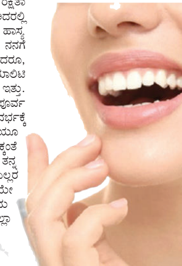
ನಗುವುದು ಕೂಡ ಒಂದು ಟ್ಯಾಲೆಂಟ್. ನಾನು ರಿಯಾಲಿಟಿ ಶೋ ಎಂದೂ ನೋಡಿದವಳೇ ಅಲ್ಲ,

ಅಯ್ಯಷ್ಟ, ನಗದೇ ಇರುವವರಿಗಿಂತ ಏಳು ವರ್ಷ ಅಧಿಕ ಎಂದು ಇತ್ತೀಚೆಗೆ ಓದಿದ ನೆನಪು. ನಗುವಿನಲ್ಲಿ ದೀರ್ಘಾಯುಷ್ಯಕ್ಕೂ ನೆರವಾಗಿ ಸಂಬಂಧ ಇಲ್ಲದಿದ್ದರೂ, ನಗು ಅರೋಗ್ಯಕರ ಜೀವನಕ್ಕೆ ನಾಂದಿಯಾಗಿರುತ್ತದೆ. ನಗುವು ಒತ್ತಡವನ್ನು ಕಡಿಮೆ ಮಾಡುವುದಲ್ಲದೆ, ಸಂಕೋಚದ ಸಮಾಜವನ್ನೂ ಬದುಕುಗಡೆ ಮಾಡುತ್ತದೆ. ನಗುವು ಸಂಕೋಚದ ಸಂಕೇತ. ಇಂದಿನ ಧಾಂಪತದ ಜೀವನ ಶೈಲಿ, ಒತ್ತಡದ ನಡುವೆ ಮನುಷ್ಯನು ನಗುವುದನ್ನು ಮರೆತಿದ್ದಾನೆ. ತನ್ನವರಿಗಾಗಿ ಅಲ್ಲ ಸಮಯವನ್ನೂ ಮೀಸಲಾಗಿಡದೆ, ತೊಳಲಾಡುವುದನ್ನು ಕಾಣುತ್ತೇವೆ. ಗುರಿಗಳನ್ನು ಮುಟ್ಟುವ ಹಂಬಲದಲ್ಲಿ ಕುಟುಂಬಕ್ಕೆ ಹೆಚ್ಚು ಸಮಯ ನೀಡಲು ಸಾಧ್ಯವಾಗದೆ ಹೆಚ್ಚಿನ ಸಮಯ ಮುಖ ಗಂಟಿಕ್ಕಿರುವುದನ್ನು ಕಾಣಬಹುದು. ಕೆಲವರು ಹೆಚ್ಚು ಅಭೀರವಾಗಿದ್ದರೆ ಸ್ವಾಸ್ಥ್ಯಮಾನ, ಘನತೆ ಹಾಗೂ ಗೌರವ ಸಿಗುತ್ತದೆ ಆಗುತ್ತದೆ ಆದರೆ ನನ್ನ ಪ್ರಕಾರ, ಇದು ತಮ್ಮ ಕಲ್ಪನೆ. ಸಂದರ್ಭಕ್ಕೆ ತಕ್ಕಂತೆ ಮುಖವಾಚವನ್ನು