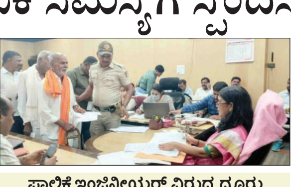
ಪಾಲಿಕೆ ಇಂಜಿನಿಯರ್ ವಿರುದ್ಧ ದೂರು