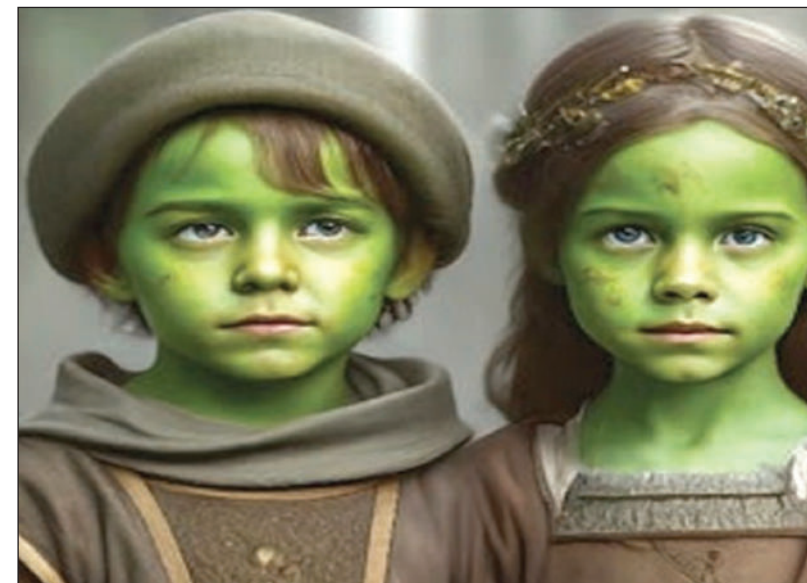
ಒಟ್ಟಿನಲ್ಲಿ ಆಕೆಯು ಓರ್ವ ನಿರೂಪಕ ಹಸಿರು ಹುಡುಗಿಯಾಗಿ ಇಂಗ್ಲೆಂಡಿನ ಜನಪದ ಕಥೆಗಳನ್ನು ಬೆರೆತು ಹೋದಳು. ಈಗ ಆಧುನಿಕ ವೈದ್ಯಕೀಯ ವಿಜ್ಞಾನ