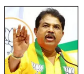
ದಿನ ಬೆಳಗಾದರೆ ಭೌಗೋಳಿಕ ರಾಜಕೀಯದ ಬಗ್ಗೆ ಪ್ರವಚನ ಮಾಡುವ ಎಪಿಸಿ ಅಧ್ಯಕ್ಷ ಮಲ್ಲಿ ಕಾರ್ನಾಟ ಬಿರ್ಗ ಹಾಗೂ ಅವರ ಸುಪುತ್ರ ಪ್ರಿಯಾಂಕು ಬಿರ್ಗ ಅವರು ದಶಕಗಳಿಂದ ಅಧಿಕಾರ ಅನುಭವಿಸುತ್ತಾ ಕಲ್ಯಾಣ ಕರ್ನಾಟಕ ಭಾಗದ ಜನರ ಹೊಟ್ಟೆ ಮೇಲೆ ಹೊಡೆಯುತ್ತಿರುವ ಆಸ್ತಿ ಸರ್ವಾಧಿಕಾರಿಗಳು ಯಾರು? ಎಂದು ಪ್ರಶ್ನಿಸಿದ್ದಾರೆ. ಕಲ್ಯಾಣ ಕರ್ನಾಟಕ ಭಾಗವನ್ನು ಅಧಿಕಾರ ಗುಲಾಮಗಿರಿಗೆ ತಳ್ಳಿದವರು ಯಾರು? ಈ ಪ್ರಶ್ನೆಗಳಿಗೆ ಉತ್ತರಿಸುತ್ತಾರಾ? ಎಂದು ಅಶೋಕ್ ಅವರು ಕೇಳಿದ್ದಾರೆ.

ಬೆಂಗಳೂರು: ರಾಜ್ಯದ 26 ಜಿಲ್ಲೆಗಳ ತಲಾ ಆದಾಯ ರಾಜ್ಯದ ಸರಾಸರಿ ತಲಾ ಆದಾಯಕ್ಕಿಂತ ಕೆಳಗಿರುವುದು ಪ್ರಾದೇಶಿಕ ಅಸಮಾನತೆ ಎಷ್ಟು ಗಂಭೀರವಾಗಿದೆ ಎಂಬುದಕ್ಕೆ ಕನ್ನಡಿ ಹಿಡಿದಂತಾಗಿದೆ ಎಂದು ವಿಧಾನಸಭೆ ವಿರೋಧಪಕ್ಷದ ನಾಯಕ ಆರ್. ಅಶೋಕ್ ಅವರು ತಿಳಿಸಿದ್ದಾರೆ. ಈ ಸಂಬಂಧ ಈ ವಿಚಾರವನ್ನು ಪೋಸ್ಟ್ ಮಾಡಿರುವ ಅವರು, ಕರ್ನಾಟಕದ 31 ಜಿಲ್ಲೆಗಳ ಪೈಕಿ ಕೇವಲ 5 ಜಿಲ್ಲೆಗಳು ರಾಜ್ಯದ ಸರಾಸರಿ ತಲಾ ಆದಾಯಕ್ಕಿಂತ ಹೆಚ್ಚು ತಲಾದಯ ಹೊಂದಿವೆ ಎಂದಿದ್ದಾರೆ. ಆದರಲ್ಲೂ ಕಲ್ಯಾಣ ಕರ್ನಾಟಕದ 5 ಜಿಲ್ಲೆಗಳು ಈ ಪಟ್ಟಿಯಲ್ಲಿ ಕಟ್ಟ ಕಡೆಯ ಸ್ಥಾನ ಪಡೆಯಿದ್ದು, ಈ ಜಿಲ್ಲೆಗಳ ತಲಾ ಆದಾಯ ರಾಜ್ಯದ ಸರಾಸರಿ ತಲಾ ಆದಾಯಕ್ಕಿಂತ ಅರ್ಧದಷ್ಟು ಕಡಿಮೆ ಇರುವುದು ಅತ್ಯಂತ ಚಿಂತಾಜನಕ ಎಂದು ಅವರು ಬೇಸರ ವ್ಯಕ್ತಪಡಿಸಿದ್ದಾರೆ.