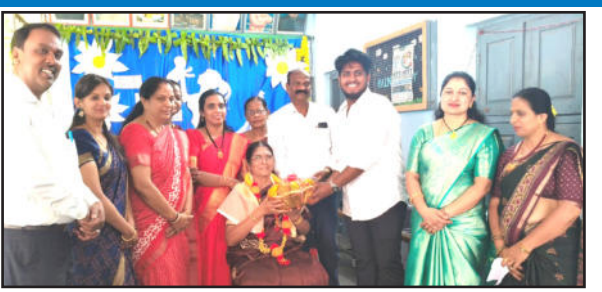
ಹಾಗೂ ಮಗುವಿನ ಜೀವನದಲ್ಲಿ ತಂದೆ ತಾಯಿಯ ಪಾತ್ರ ಎಷ್ಟು ಗಮನಾರ್ಹವಾಗಿರುತ್ತದೆಂದು ಈ ಕಾರ್ಯಕ್ರಮ ತೋರಿಸುತ್ತಿದೆ ಎಂದರು. ಪಾತ್ರಿಮಾತೃ ಸಂಸ್ಕೃತಿಗೆ ಮಾರು ಹೋಗಿ ಅನ್ನ ಸಂಸ್ಕೃತಿಯನ್ನು ಅನುಸರಿಸುತ್ತಿರುವ ಈ ಕಾಲದಲ್ಲಿ ನಮ್ಮ ಒಂದು ಧರ್ಮದ ಸಂಸ್ಕೃತಿ ಯನ್ನು ಒತ್ತಿ ಹಿಡಿಯುವಂತಹ ಮಕ್ಕಳ ಸರ್ವತೋಮುಖ ಬೆಳವಣಿಗೆಯಲ್ಲಿ ಪೋಷಕರು ಹೆಚ್ಚು ಪ್ರಮುಖ ಎಂಬುದನ್ನು ಈ ಕಾರ್ಯಕ್ರಮದ