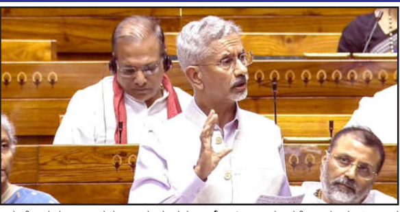
ಯಲ್ಲಿ ನಮ್ಮ ಇಂಧನ ಉದ್ಯಮಗಳ ಪ್ರಯತ್ನಗಳನ್ನು ಭಾರತೀಯ ರಾಜ ತಾಂತ್ರಿಕತೆಯು ಬೆಂಬಲಿಸಿದೆ ಎಂದು ಅವರು ಹೇಳಿದರು. ಇರಾನ್ ಧನ್ಯವಾದ ತಿಳಿಸಿ ರಾಜ್ಯಸಭೆಯಲ್ಲಿ ನಡೆದ ಚರ್ಚೆಯ ವೇಳೆ ಜೈಶಂಕರ್ ಇರಾನ್ ವಿಧೇಶಾಂಗ ಸಚಿವ ಅಬ್ದುಲ್ ಅಘ್ನಿ ಅವರು ಐರ್ನ್ ಲಾನ್ಸ್ ಹಡಗು ಕೊಟ್ಟಿ ಬಂದಿರಲಿಲ್ಲ ಅತ್ತರು ನೀಡಿದ ಕೃತಿ ಭಾರತ ಸರ್ಕಾರಕ್ಕೆ ಧನ್ಯವಾದ ತಿಳಿಸಿದ್ದಾರೆ ಎಂದು ಹೇಳಿದರು. ಇದಕ್ಕೆ ಮೊದಲು ಅಮೆರಿಕದ ದಾಳಿಯಲ್ಲಿ ಐರ್ನ್ ಡೆನ್ ಎಂಬ ಮತ್ತೊಂದು ಇರಾನ್ ಹಡಗು ಫ್ರೆಂಚ ಕರಾ ವಳಿಯ ಬಳಿ ಮುಳುಗಿ, 87 ಮಂದಿ ಮೃತಪಟ್ಟಿದ್ದಾರೆ. ಇರಾನ್‌ನಲ್ಲಿದ್ದ ಭಾರತೀಯರಿಗೆ

ಅತ್ಯುನ್ನತವಾಗಿರುತ್ತದೆ. ಅಮೆರಿಕ ಮತ್ತು ಇಸ್ರೇಲ್ ಇರಾನ್ ಮೇಲೆ ದಾಳಿ ಮಾಡಿದಾಗ ಮತ್ತು ನೆರೆಯ ಪ್ರದೇಶಗಳಲ್ಲಿನ ಯುಎಸ್ ನೆಲೆಗಳ ಮೇಲೆ ಹಾಗೂ ಇಸ್ರೇಲ್ ಮೇಲೆ ದಾಳಿ ಮಾಡುವ ಮೂಲಕ ಟೆಹ್ರಾನ್ ಪುನರುಜ್ಜೀವಿಗಾಗಿ ಭೂಲೆದ ಸಂಘರ್ಷದ ನಂತರ ಇಂಧನ ಬೆಲೆಗಳಲ್ಲಿನ ಏರಿಕೆಯ ಕುರಿತು ಅವರು, ಇಂಧನ ಮಾರುಕಟ್ಟೆಗಳ ಲಭ್ಯತೆ, ವೆಚ್ಚಗಳು ಮತ್ತು ಅಪಾಯಗಳನ್ನು ಸಂಪೂರ್ಣವಾಗಿ ಗಣನೆಗೆ ತೆಗೆದುಕೊಳ್ಳುವ ಇಂಧನ ಭದ್ರತೆಯನ್ನು ಖಚಿತಪಡಿಸಿ ಕೊಳ್ಳಲು ಸರ್ಕಾರ ಬದ್ಧವಾಗಿದೆ ಎಂದು ಹೇಳಿದರು. ನಮ್ಮ, ಭಾರತೀಯ ಗ್ರಾಹಕರ ಹಿತಾಸಕ್ತಿ ಪ್ರಮುಖ ಆದ್ಯತೆಯಾಗಿದೆ ಮತ್ತು ಯಾವಾಗಲೂ ಇರುತ್ತದೆ. ಅಗತ್ಯವಿರುವಲ್ಲಿ, ಈ ಅಸ್ಥಿರ ಪರಿಸ್ಥಿತಿ