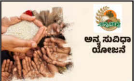
ಕೂಡಲೇ ನ್ಯಾಯಬೆಲೆ ಅಂಗಡಿಗಳ ತೆರಳಿ ಇ-ಕೆ.ವೈ ಸಿ ಮಾಹಿತಿ ಮೊಬೈಲ್ ಸಂಖ್ಯೆಗಳನ್ನು ಅಪ್ಡೇಟ್ ಮಾಡಿ ಕೊಂಡಿರಬೇಕು. ನೋಂದಾಯಿಸಿ ಅರ್ಹ ಫಲಾನು ಭವಿಗಳ ಮನೆ ಬಾಗಿಲಿಗೆ ಅಯು ತಿಂಗಳ 6 ರಿಂದ 15ನೇ ತಾರೀಖು ನೊಳಗೆ ನ್ಯಾಯಬೆಲೆ ಅಂಗಡಿಯಿಂದ ಪಡಿತರವನ್ನು ಪಡೆಯುವುದು. ಅರ್ಹ ಫಲಾನು ಭವಿಗಳು ಸದರಿ ಅನ್ನ ಸುವಿಧಾ ಯೋಜನೆಯ ಸದುಪಯೋಗವೆಡೆಗೆ ಕೊಳ್ಳುವಂತೆ ಹಾಗೂ ಹೆಚ್ಚಿನ ಮಾಹಿತಿ ಗಾಗಿ ತಾಲ್ಲೂಕಿನ ಅರ್ಹ ಶಿರಸ್ತೇ ದಾರ್ ಮತ್ತು ಅರ್ಹ ನಿರೀಕ್ಷಕರುಗಳನ್ನು ಸಂಪರ್ಕಿಸುವುದು. ಅರ್ಹ ನಿರೀಕ್ಷಕರ ಕಾರ್ಯಾಲಯವನ್ನು ಸಂಪರ್ಕಿಸುವಂತೆ ಜಿಲ್ಲಾಧಿಕಾರಿ ಪ್ರಕಟಣೆಯಲ್ಲಿ ತಿಳಿಸಿದ್ದಾರೆ.

ಹಾಸನ: ಅನ್ನ ಸುವಿಧಾ ಯೋಜನೆಯ ರಾಜ್ಯಾದ್ಯಂತ ಅನುಷ್ಠಾನಗೊಂಡಿದ್ದು, 75 ಪುಟ್ಟ ಪುಟ್ಟ ಮೇಲ್ಮಟ್ಟ ಒಂಟಿ ಹಿರಿಯ ನಾಗರಿಕರು ಮಾತ್ರ ಇರುವ ಮನೆಗಳಿಗೆ ಅನ್ನ ಸುವಿಧಾ ಮಾಡಲು ಮೂಲಕ ಅರ್ಹ ಫಲಾನುಭವಿಗಳ ಮನೆಯ ಬಾಗಿಲಿಗೆ ಪಡಿತರವನ್ನು ವಿತರಣೆ ಮಾಡಲಾಗುವುದು. ಜಿಲ್ಲೆಯಲ್ಲಿ ಒಟ್ಟು 15,207 ಫಲಾನುಭವಿಗಳಿದ್ದು 3229 ಫಲಾನು ಭವಿಗಳು ಅನ್ನ ಸುವಿಧಾ ಯೋಜನೆ ಯಡಿ ನೋಂದಾವಣೆ ಮಾಡಿಕೊಂಡಿ ರುತ್ತಾರೆ. ಉಳಿದ 11,978 ಪಡಿತರ ಚೀಟಿದಾರರು ಮಾರ್ಚ್ 2026 ರ ಮಾರ್ಚ್ 1 ರಿಂದ 6ನೇ ತಾರೀಖು ನೊಳಗೆ ನ್ಯಾಯಬೆಲೆ ಅಂಗಡಿಗಳ ತೆರಳಿ ನೋಂದಣಿ ಮಾಡಿಕೊಂಡು ಯೋಜನೆಯ ಪ್ರಯೋಜನ ಪಡೆದುಕೊಳ್ಳಬಹುದು. ಯೋಜನೆಯ ಅನುಕೂಲ ಪಡೆಯಲು ಮೊದಲಿಗೆ ಸಂಖ್ಯೆಯನ್ನು ಹೊಂದುವುದು ಕಡ್ಡಾಯವಾಗಿದ್ದು, ಮೊದಲಿಗೆ ಸಂಖ್ಯೆಯನ್ನು ನೋಂದಣಿ ಮಾಡಿದ ಅರ್ಹ ಫಲಾನುಭವಿಗಳು