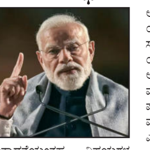
ಅವಕಾಶಗಳ ಕೊರತೆಯಿಂದಾಗಿ ಯಾವುದೇ ಹೆಚ್ಚುವುಗಳು ಹಿಂದು ಸರಿಯಾಗಿರುವ ಎಂಬುದು ಮುಖ್ಯ. ಯುವ ಸಂಕೋಧಕರು ಹೊಸ ಆಲೋಚನೆಗಳ ಮೇಲೆ ಕೆಲಸ ಮಾಡಲು ಸಾಕಷ್ಟು ಅವಕಾಶಗಳನ್ನು ಪಡೆಯುವ ಸಂಶೋಧನಾ ಪರಿಸರ ವ್ಯವಸ್ಥೆಯನ್ನು ನಾವು ರಚಿಸಬೇಕು ಎಂದು ಅವರು ಹೇಳಿದರು. ಅರೋಗ