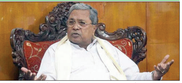
ಸಿದ್ದರಾಮಯ್ಯ, ಡಿ.ಕೆ.ಶಿವಕುಮಾರ್ ಅವರ ರಾಜಕೀಯ ಬಾಂಧವ್ಯ ಬಜೆಟ್ ಅಧಿವೇಶನದ ನಂತರ ಸ್ವರೂಪ ಬದಲಿಸುವ ಸಾಧ್ಯತೆ ಇದೆ. ಅದಕ್ಕೆ ಹಿರಿಯ ಶಾಸಕರು ಕೂಡ ಧ್ವನಿಗೂಡಿಸಿದ್ದಾರೆ. ಇತ್ತ ಡಿ.ಕೆ.ಶಿವಕುಮಾರ್ ಅವರ ಪರವಾಗಿ ಕಿರಿಯ ಶಾಸಕರು ಬ್ಯಾಟಿಂಗ್ ಮಾಡುತ್ತಿದ್ದು, ಡಿ.ಕೆ.ಶಿವಕುಮಾರ್ ಅವರಿಗೆ ಅವಕಾಶ ನೀಡಬೇಕೆಂದು ಒತ್ತಡ ಹೇರುವ ಪ್ರಯತ್ನ ಮಾಡುತ್ತಿದ್ದಾರೆ. ತೆರವುರೇರ್ಪಣೆ ಮಾಡುವಂತೆ ಒತ್ತಡ ಹೇರುವ ಗುರಿಯನ್ನು ಕಾರಣವಾಗಿ ಸಿದ್ದರಾಮಯ್ಯ ಅವರು ಬಜೆಟ್‌ನಲ್ಲಿ ನಡೆಸುವ ಸಂದರ್ಭದಲ್ಲಿ ದೆಹಲಿಗೆ ತೆರಳುತ್ತಿರುವುದು ಮತ್ತಷ್ಟು ಕುತೂಹಲ ಕೆಳಗಿಸಿದೆ. ಡಿ.ಕೆ.ಶಿವಕುಮಾರ್ ಆಸ್ಥಾನ ಚುನಾವಣೆಯ ಉಸ್ತುವಾರಿಯಾಗಿರುವುದರಿಂದ ಪದೇ ಪದೇ ದೆಹಲಿಗೆ ತೆರಳುತ್ತಿದ್ದು, ಹೈ ಕಮಾಂಡ್ ನಾಯಕರನ್ನು ಭೇಟಿ ಮಾಡುತ್ತಿದ್ದಾರೆ. ಆದರೆ ಸಮಯದಲ್ಲಿ ಸಿದ್ದರಾಮಯ್ಯ ಅದೇ ದೆಹಲಿಗೆ ತೆರಳುವ ಸಾಧ್ಯತೆ ಇದೆ. ಈವರೆಗೂ ಹಾಲು-ಜೇನಿನಂತಿರುವ