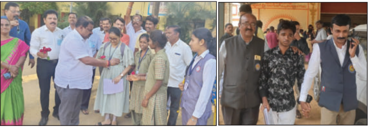
ಹಾಗೂ ವೆಬ್‌ಕಾನ್ಸಿಂಗ್ ವ್ಯವಸ್ಥೆಗಳು ಸಮರ್ಪಕವಾಗಿ ಕಾರ್ಯನಿರ್ವಹಿಸಿದ್ದು, ಅಕ್ರಮ ಚಟುವಟಿಕೆಗಳಿಗೆ ಆಸ್ಪದ ನೀಡಲಿಲ್ಲ. ಪರೀಕ್ಷಾ ಕೇಂದ್ರಗಳಲ್ಲಿ ಶುದ್ಧ ಕುಡಿಯುವ ನೀರು, ಶೇ.ಕಾಲಿಯು, ಸಮರ್ಪಕ ಓಣೋಪಕರಣ ಸೇರಿ ಎಲ್ಲಾ ಮೂಲಸೌಕರ್ಯ ಒದಗಿಸಲಾಗಿತ್ತು.

ಮೊದಲ ದಿನ ನಡೆದ ಕನ್ನಡ ಪರೀಕ್ಷೆಗೆ ವಿದ್ಯಾರ್ಥಿಗಳು ಆತ್ಮತೃಪ್ತಿಯಿಂದ ಬಂದರು. ಜಿಲ್ಲಾದ್ಯಂತ 78 ಪರೀಕ್ಷಾ ಕೇಂದ್ರ ತೆರೆದಿದ್ದು ಕೆಲವೆಡೆ ಮಕ್ಕಳಿಗೆ ಪೂರೈಕೆಯಾದ ಕುಳಿ ಕೊರತೆಯಿಂದಾಗಿ ಕೆಲವು ಕೇಂದ್ರಗಳಲ್ಲಿ ವಿದ್ಯಾರ್ಥಿಗಳಿಗೆ ಹಾಗೂ ಅಧಿಕಾರಿಗಳಿಗೆ ಮಕ್ಕಳಿಗೆ ಆತ್ಮತೃಪ್ತಿಯ ತುಂಬಿದರು. ಪರೀಕ್ಷಾ ಕೇಂದ್ರದ ಸುತ್ತ 200 ಮೀ. ವ್ಯಾಪ್ತಿ ನಿಷೇಧಾಜ್ಞೆ ಜಾರಿಗೊಳಿಸಿದುದರಿಂದ ಪರೀಕ್ಷಾ ಸಮಯದಲ್ಲಿ ಸಾರ್ವಜನಿಕರ ಓಡಾಟ ನಿಷೇಧಿಸಲಾಗಿತ್ತು. ಹತ್ತಿರದ ಜಿಲ್ಲಾ ಅಂಗಡಿಗಳನ್ನು ಬಂದ ಮಾಡಿ ಸಲಾಗಿತ್ತು. ಯಾವುದೇ ಅಕ್ರಮಗಳಿಗೆ ಅವಕಾಶ ನೀಡದೆ ಪರೀಕ್ಷೆ ನಡೆಸಲಾಯಿತು.