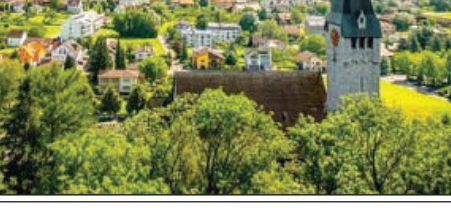
ಇಲ್ಲಿನ ಸ್ವಿಟ್ಜರ್ ಸಣ್ಣದ್ದು ಆದರೆ ಪ್ರಭಾವಿ. ಇಲ್ಲಿ ಬದುಕು ಸರಳ, ತ್ರೀಮಂತ ಮತ್ತು ಸುರಕ್ಷಿತ. ನಿನ್ನ ಯುರೋಪ್ ಪ್ರವಾಸಕ್ಕೆ ಹೋದರೆ ಈ ಪುಟಾಣಿ ರಾಜ್ಯವನ್ನು ತಪ್ಪಿಸಬೇಡಿ. ರಸ್ತೆಯಲ್ಲಿ ಸ್ವಿಟ್ಜರ್‌ಲ್ಯಾಂಡ್ ಅಥವಾ ಅಭ್ಯಾಸದಿಂದ ಬಳೆ ಬಂದು ಒಂದು ದಿನ ಕಳೆಯಿರಿ. ಈ ದೇಶ ನಿಮಗೆ ಜಗತ್ತಿನ ತ್ರೀಮಂತತೆಯ ಹೊಸ ಅರ್ಥವನ್ನು ಕಲಿಸುತ್ತದೆ!

ಸುರಕ್ಷತೆ ಮತ್ತು ಕಾನೂನು ಪ್ರವೃತ್ತಿ: ಕಳೆದ ಅತ್ಯಂತ ಸುರಕ್ಷಿತ ದೇಶಗಳಲ್ಲಿ ಒಂದು. ಕ್ರಿಮಿನ್ ರೀಟ್ ಅತ್ಯಂತ ಕಡಿಮೆ. ಕೊಲೆ, ಸುಲಿಗೆ, ಭ್ರಷ್ಟಾಚಾರ ಅಪರಾಧ. ದೇಶದ ಜೈಲಿನಲ್ಲಿ ಕೆಲವು 7-10 ಜನ ಮಾತ್ರ ಇದ್ದಾರೆ. ದೀರ್ಘಕಾಲದ ಶಿಕ್ಷಣ ಅಭ್ಯಾಸ ದೇಶದ ಜೈಲು ಬಳಸುತ್ತದೆ. ನಿವಾಸಿಗಳು ಮನೆಯ ಬಾಗಿಲು ತೆರೆದಿಟ್ಟು ಹೋಗುತ್ತಾರೆ ಎನ್ನುವ ಕಥೆಗಳಿವೆ. ಪ್ರತಿ ನಿವಾಸಿಯೂ ಉನ್ನತ ಜೀವನಮಟ್ಟವನ್ನು ಅನುಭವಿಸುತ್ತಾನೆ, ಉನ್ನತ ಶಿಕ್ಷಣ, ಆರೋಗ್ಯ