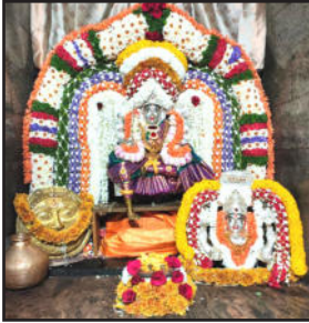
ಹತ್ತಾರು ಗ್ರಾಮಗಳ ಗ್ರಾಮದೇವತೆ

• ಪ್ರಜಾವಾಣಿಯ ವರದಿ ಅರಸೀಕೆರೆ: ಜೇನುಕಲ್ಲು ಸಿದ್ಧೇಶ್ವರ ಸ್ವಾಮಿ ಹಾಗೂ ಯಳವಾರ ಹುಚ್ಚಮ್ಮ ದೇವಿಯ ಜೋಡಿ ರಥೋತ್ಸವವು ಸಹಸ್ರಾರು ಭಕ್ತರೊಡನೆ ಸಮೃದ್ಧವಾಗಿ ವಿಜೃಂಭಣೆಯಿಂದ ಜರುಗಿತು. ಯಳವಾರ ಗ್ರಾಮ ಸೇರಿದಂತೆ ಸುತ್ತಮುತ್ತಲಿನ ಹತ್ತಾರು ಗ್ರಾಮಗಳಿಗೆ ಗ್ರಾಮದೇವತೆಯಾಗಿರುವ ಹುಚ್ಚಮ್ಮ ದೇವಿ ಜಾತ್ರಾ ಮಹೋತ್ಸವದಲ್ಲಿ ಜೇನುಕಲ್ಲು ಸಿದ್ಧೇಶ್ವರ ಸ್ವಾಮಿಯ ರಥೋತ್ಸವವೂ ಸಹ ಇಲ್ಲಿ ನಡೆಯುವುದರಿಂದ ಜೋಡಿ ರಥೋತ್ಸವವೆಂದೆಂದೆ ಪ್ರಸಿದ್ಧಿಯಾಗಿದೆ. ಹಾಗಾಗಿ ಈ ಜೋಡಿ ರಥೋತ್ಸವವನ್ನು ಕಟ್ಟುಬಿಟ್ಟು ದೇವಿಯ ಹುಚ್ಚಮ್ಮ ದೇವಿಯ ಜೊತೆ ಜೊತೆಗೆ ತಾಲೂಕಿನ ಜನತೆ ಹೆಚ್ಚಿನ ಸಂಖ್ಯೆಯಲ್ಲಿ ಪಾಲ್ಗೊಳ್ಳುತ್ತಾರೆ. ರಥೋತ್ಸವಕ್ಕೂ ಮುನ್ನ ರಾತ್ರಿಪೂರ್ಣ ಉಚ್ಚಮ್ಮ ದೇವಿ ಸಮೇತ ಜೇನುಕಲ್ಲು ಸಿದ್ಧೇಶ್ವರ ಸ್ವಾಮಿಯ ಉತ್ತಮವಾಗಿ ಗ್ರಾಮದಲ್ಲಿ ನಡೆಯುತ್ತದೆ ಮುಂಜಾನೆ ಕರ್ಪೂರ ಸೇವೆ ಬಳಿಕ ಜೇನುಕಲ್ಲು ಸಿದ್ಧೇಶ್ವರ