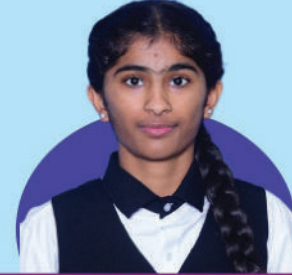
ANANYA K-97, E-96, P-100, C-98, M-100, B-97 Total: 588