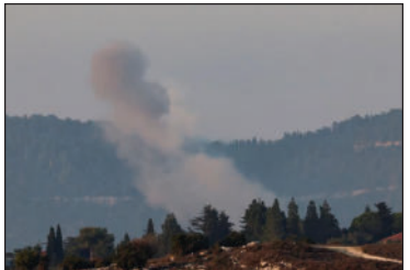
ಸಿ. ಈ ದಾಳಿಗಳ ಕುರಿತಾಗಿ ಪ್ರತಿಭಟನೆ ಇಸ್ರೇಲ್ ಮಿಲಿಟರಿ ತಕ್ಷಣ ಸ್ವಂದಿ ಸಿಲ್ವೆ, ಅದಾಗ್ಯೂ ಆ್ಯಂಬುಲೆನ್ಸ್‌ನಲ್ಲಿ ಇರಾನ್ ಬೆಂಬಲಿತ ಹಿಜ್ಬುಲ್ಲಾ ಬಂಡುಕೋರರು ಇರುವ ಮಾಹಿತಿ ಮೇರೆಗೆ ದಾಳಿ ಮಾಡಲಾಗಿದೆ ಎಂದು ಇಸ್ರೇಲ್ ತಿಳಿಸಿದೆ.

ಬೈರೂತ್: ಲೆಬನಾನ್ ಮತ್ತು ಇಸ್ರೇಲ್ ನಡುವೆ ನೇರ ರಾಜತಾಂತ್ರಿಕ ಮಾತುಕತೆಗಳು ಆರಂಭವಾಗಿದ್ದರೂ ಲೆಬನಾನ್ ಮೇಲೆ ಇಸ್ರೇಲ್ ದಾಳಿ ಮಾಡಿದೆ. ಬುಧವಾರ ತಡರಾತ್ರಿ ನಡೆದ ಘಟನೆಯಲ್ಲಿ ನಾಲ್ವರು ಮೃತಪಟ್ಟು ಆರು ಜನರಿಗೆ ಗಂಭೀರ ವಾಗಿ ಗಾಯಗೊಂಡಿದ್ದಾರೆ.