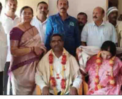
ಇಂತಹ ವ್ಯಕ್ತಿಯ ನಿರಾಪರಣೆ ಸೇವೆಯನ್ನು ಗುರುತಿಸಿ ಸರ್ಕಾರ ಪ್ರಶಸ್ತಿ ನೀಡಿರುವುದು ಅತ್ಯಂತ ಸ್ತುತಾರ್ಹ ಹಾಗೂ ಅಭಿನಂದನಾರ್ಹವಾಗಿದೆ ಎಂದರು.