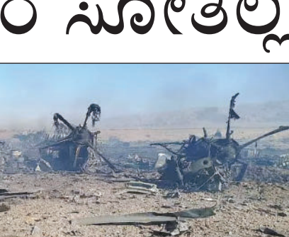
ಮಿಲಿಟರಿ ಮತ್ತು ಸರ್ಕಾರಿ ಜಾಲಗಳಿಗೆ ವಿಘ್ನೇಷಿಸಿ ನಿರ್ದೇಶಕ ಕಾಶ್ ಪರ್ಜೇಲ್ ಅವರ ವೈಯುಕ್ತಿಕ ಇಮೇಲ್‌ಗಳು ಇತ್ತೀಚೆಗೆ ಆಸ್ಪೆನ್ ನಲ್ಲಿ ಸೋರಿಕೆಯಾಗಿದ್ದವು. ಇರಾನ್ ಬೆಂಬಲಿತ ವ್ಯಾಪಾರಿಗಳು ಅಮೇರಿಕಾದ ತ್ಯಾಜ್ಯ ನೀರಿನ ಸಂಸ್ಕರಣಾ ಘಟಕಗಳು ಮತ್ತು ವಿಮ್ಯುಟ್ ಗ್ರಿಡ್ ಗಳು ಸೇರಿ ಮೂಲಸೌಕರ್ಯ ಮತ್ತು ಸಾಂಸ್ಕೃತಿಕ ಸಂಸ್ಥೆಗಳ ಮೇಲೆ ದಾಳಿ ನಡೆಸಿದ್ದಾರೆ. ಅಗತ್ಯತೆಯ ವಿಚಾರಕ್ಕೆ ಬಂದಾಗ, ಅಮೇರಿಕಾ

ಯುಗಿಸಿಕೊಂಡಿದ್ದ ದಂಗೆಕೋರಗಿ ಸುಧಾರಿತ ಸ್ಪೋಟಕ ಸಾಧಕಗಳನ್ನು ಇರಾನ್ ಒದಗಿಸುವ ಮೂಲಕ ಕ್ರಾಂತಿಕಾರಿ ಗಾರ್ಡ್ ಪ್ರಮುಖ ಪಾತ್ರ ವಹಿಸಿತ್ತು. ಕಳೆದ ಕೆಲವು ದಶಕಗಳಲ್ಲಿ ತನ್ನ ಗಡಿಗಳನ್ನು ಮೀರಿ ಮಿಲಿಟರಿ ಪ್ರಭಾವ ಬೀರುವುದನ್ನು ಕಲಿತಿದೆ. ಆ ತಂತ್ರಗಳಲ್ಲಿ ಒಂದು ಸೈಬರ್ ಯುದ್ಧ. ಅದಕ್ಕೆ ತುಲನಾತ್ಮಕವಾಗಿ ಕಡಿಮೆ ವೆಚ್ಚ ತಗಲುವ ಜೋತೆಗೊಳಿಸುವುದು ಅಂದಿ.