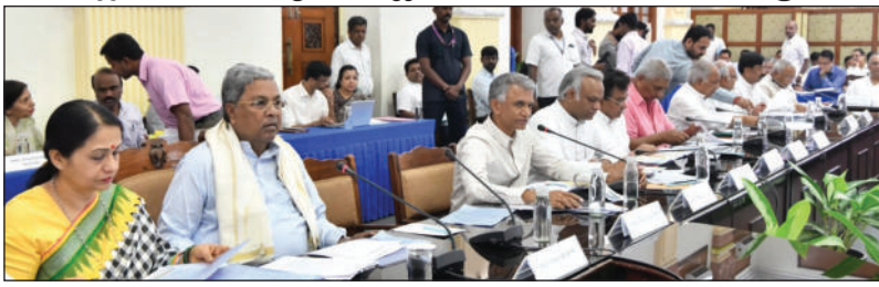
ಕೈಗೊಳ್ಳಬೇಕೆಂದು ನಿರ್ದೇಶಿಸಿದರು. ಅನುದಾನದ ಕೊರತೆಯನ್ನು ಸರ್ಕಾರದ ಕೊರತೆಯನ್ನು ಕುಡಿಯುವ ನೀರಿನ ವ್ಯವಸ್ಥೆ ಕಲ್ಪಿಸಬೇಕು. ಕುಡಿಯುವ ನೀರು ಪೂರೈಕೆಯನ್ನು ಖಾತ್ರಿಪಡಿಸಲು ಯಾವುದೇ ಅನು ದಾನದ ಕೊರತೆಯಿಲ್ಲ. ಜಿಲ್ಲಾಧಿಕಾರಿಗಳ ವರದಿ ಆಧಾರದ ಮೇಲೆ ಅಗತ್ಯ ಅನುದಾನವನ್ನು ಒದಗಿಸಲು ಹಣಕಾಸು ಇಲಾಖೆಗೆ ಈಗಾಗಲೇ ಸೂಚನೆ ನೀಡಲಾಗಿದೆ ಎಂದು ತಿಳಿಸಿದರು.

ಬೆಂಗಳೂರು: ರಾಜ್ಯದ ಐದು ಜಿಲ್ಲೆಗಳನ್ನು ಹೊರತು ಪಡಿಸಿ ಬೇರೆ ಎಲ್ಲಾ ಜಿಲ್ಲೆಗಳಲ್ಲಿ ಮುಂಗಡ ಕೊರತೆ ನಿರೀಕ್ಷಿಸಲಾಗಿದ್ದು, ಕುಡಿಯುವ ನೀರಿಗೆ ತೊಂದರೆ ಯಾಗದಂತೆ ಮುಂಜಾಗ್ರತಾ ಕ್ರಮಕೈಗೊಳ್ಳಲು ಜಿಲ್ಲಾಧಿಕಾರಿಗಳಿಗೆ ಮುಖ್ಯಮಂತ್ರಿ ಸಿದ್ದರಾಮಯ್ಯ ಅವರು ಸೂಚಿಸಿದರು.