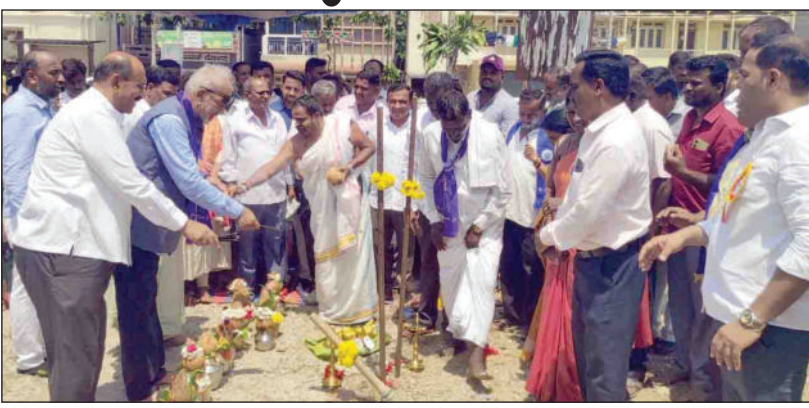
ಕಾಮಗಾರಿಗೆ ಭೂಮಿಪೂಜೆ ನೆರವೇರಿಸಿ ಮಾತನಾಡಿದ ಅವರು, ಕಳೆದ 8 ವರ್ಷಗಳ ಹಿಂದೆ ಪಟ್ಟಣದ ಹೃದಯ ಭಾಗದಲ್ಲಿನ ಹಳೆಯ ಭವನವನ್ನು ನೆಲಸಮಗೊಳಿಸಿ 1.50 ಕೋಟಿ ರೂ. ವೆಚ್ಚದಲ್ಲಿ ನಾನು ಶಾಸಕ, ಸಚಿವನಾಗಿದ್ದ ವೇಳೆ ಶಂಕಸ್ಥಾಪನೆ ನೆರವೇರಿಸಿದ್ದೆ. ನಂತರದ ಚುನಾವಣೆಗಳಲ್ಲಿ ನಾನು ಸೋಲನ್ನು ಕಾಣಬೇಕಾಯಿತು. ಹಿಂದಿನ ಅವಧಿಯಲ್ಲಿ ಶಾಸಕನಾಗಿದ್ದ ಗುರು ಭವನದ ಕಾಮಗಾರಿ ಪೂರ್ಣಗೊಳಿಸಲು ಮುಂದಾಗಲಿಲ್ಲ. ಆದೇ ರೀತಿ ನನ್ನ ಅವಧಿ ಯಲ್ಲಿಯೇ ತಾಲ್ಲೂಕು ಕಛೇರಿ ಅರಕಲಗೂಡು ಅಂಬೇಡ್ಕರ್ ಪ್ರತಿಮೆ ಅನಾವರಣ ಮಾಡಿದ್ದೆ. ಅಲ್ಲಿಯೂ ಕೂಡ ಗೋಪುರ ನಿರ್ಮಿಸುವ ಕೆಲಸ ಆಗಿರಲಿಲ್ಲ. ಹಾಗಾಗಿ ಈ