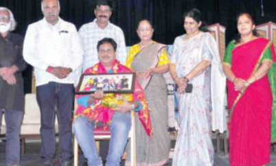
ಮೇಲೆ ನೆನಪಾಗುತ್ತದೆ. ಆ ನಾಟಕದಲ್ಲಿ ಅಭಿನಯ ಮಾಡಿದ ಅನೇಕ ಪ್ರಾಚಾರ್ಯರು ಇಲ್ಲಿದ್ದಾರೆ. ಕಲಾಭವನ ವೇದಿಕೆ ಅನೇಕ ಪ್ರತಿಭೆಗಳನ್ನು ಹೊರತಂದಿದೆ ಎಂದು ಹೇಳಿದರು.