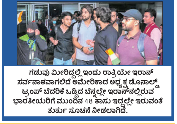
ಗಡುವು ಮೀರಿದ್ದಲ್ಲಿ ಇಂದು ರಾತ್ರಿಯೇ ಇರಾನ್ ಸರ್ವನಾಶವಾಗಲಿದೆ ಅಮೇರಿಕಾದ ಅಧ್ಯಕ್ಷ ಡೊನಾಲ್ಡ್ ಟ್ರಂಪ್ ಬೆರಲಿಕೆ ಒಡ್ಡಿದ ಬೆನ್‌ಲೈನ್ ಇರಾನ್‌ನಲ್ಲಿರುವ ಭಾರತೀಯರಿಗೆ ಮುಂದಿನ 48 ತಾಸು ಇದ್ದಲ್ಲೇ ಇರುವಂತೆ ತುರ್ತು ಸೂಚನೆ ನೀಡಲಾಗಿದೆ.

08 ಏಪ್ರಿಲ್ 2026 ಬುಧವಾರ ಬೆಲೆ ₹ 2.00 ಸಂಪುಟ : 20 ಸಂಚಿಕೆ : 29 ಪುಟ-4 ಹಾಸನ E-mail : prajodayahs@gmail.com RNI NO: KARKAN/2007/22629