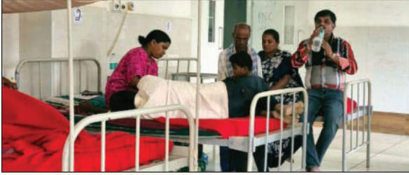
ಅಸನದ ಮೇಲೆ ನಿರ್ದೇಗಿ ಜಾರುವ ಜನರು ವಾರ್ಡ್‌ನ ಹೊರಗೆ ಗರ್ಭಿಣಿ ಹಾಗೂ ಬಾಣಂತಿಯರು ಸಂಬಂಧಿಕರು ಕೂರುವುದಾಗಿ ಅಸನಗಳನ್ನು ಅಳವಡಿಸಲಾಗಿದೆ. ಆದರೆ, ಅವು ಸಂಪೂರ್ಣ ಮುರಿದು ಬೀಳುವ ಸ್ಥಿತಿಯಲ್ಲಿವೆ. ಅವುಗಳ ಮೇಲೆಯೇ ಜನರು ನಿರ್ದೇಗಿ ಜಾರುವುದನ್ನು ಕಾಣಬಹುದು. ನರ್ಸ್ ಹಾಗೂ ವೈದ್ಯರು ಇದನ್ನೆಲ್ಲಾ ಗಮನಿಸಿದರೂ ಕೆಲವು ಕಾಣದಂತೆ ಇರುವುದು ಸಮಸ್ಯೆ ಹೆಚ್ಚಾಗಲಾರಾಜಿನೆಂದಿದೆ.

ಪ್ರಜೋದಯ ವರದಿ ಹಾಸನ: ನಗರದ ಮಹಿಳಾ ಮತ್ತು ಮಕ್ಕಳ ಆಸ್ಪತ್ರೆಯಲ್ಲಿ ಜನಿಸಿದ ಮಗು ಹಾಗೂ ತಾಯಿ ಸುರಕ್ಷತೆಗಾಗಿ ಇರುವ ಕೊಠಡಿಗಳು ಜನ ಸಂದನೆಯಿಂದ ತುಂಬಿ ತುಳುಕುತ್ತಿದ್ದು ಇದು ಆಸ್ಪತ್ರೆಯೇ ದನಗಳ ಜಾತ್ಯೋ ಎಂಬ ಸಂಶಯ ಮೂಡುತ್ತಿದೆ. ಹಾಸನ ವೈದ್ಯಕೀಯ ವಿಜ್ಞಾನಗಳ ಸಂಸ್ಥೆ (ಹಿಮ್) ಆಧೀನದಲ್ಲಿರುವ ಮಹಿಳಾ ಮತ್ತು ಮಕ್ಕಳ ಆಸ್ಪತ್ರೆ ಕಾರ್ಯಾರಂಭ ಮಾಡಿ ವರ್ಷ ಸಮೀಪಿಸುತ್ತಿದೆ. ನಿತ್ಯ 15 ರಿಂದ 20 ರಂತೆ ತಿಂಗಳಿಗೆ ಸರಾಸರಿ 500 ಹೆರಿಗೆಯಾಗುತ್ತವೆ. ಸಾಮಾನ್ಯ ಹೆರಿಗೆಯಾದ ತಕ್ಷಣ ಮಗು ಹಾಗೂ ತಾಯಿಯನ್ನು ಜನರಲ್ ವಾರ್ಡ್‌ಗಳ ಸ್ವಲ್ಪಾಂತರಿಸುತ್ತಾರೆ. ಉಸಿರಾಟ ಸಮಸ್ಯೆ, ತೊಕಲಿ ಬದಲಾವಣೆ ಹಾಗೂ ಇನ್ನಿತರ ಆರೋಗ್ಯ ಸಮಸ್ಯೆಯಿಂದ ಬಳಲುವ ಮಕ್ಕಳನ್ನು ಮಾತ್ರ ನವಜಾತ ಶಿಶುಗಳ ತೀವ್ರ ನಿರ್ವಹಣೆಗೆ ದಾಖಲಿಸುತ್ತಾರೆ. ಅಲ್ಲಿಗೆ ವೈದ್ಯರು ಹಾಗೂ ಸಿಬ್ಬಂದಿ ಹೊರತುಪಡಿಸಿ ಬೇರೆ ಯಾರಿಗೂ ಪ್ರವೇಶವಿಲ್ಲ. ಅದೇ ರೀತಿ ಸಾಮಾನ್ಯ ವಾರ್ಡ್‌ಗೆ ದಾಖಲಿಸುವ ಮಕ್ಕಳ