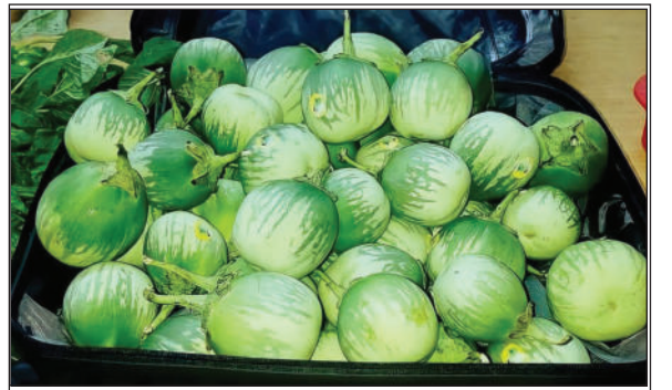
» ಈ ಗುಣಗಳಿಂದಾಗಿ, ಬದನೆಕಾಯಿ ಸೇವೆಯು ತೂಕವನ್ನು ನಿರಂತರವಾಗಿ ಸಹಾಯ ಮಾಡುತ್ತದೆ. ಕಡಿಮೆ ಕಾರ್ಬೋಹೈಡ್ರೇಟ್ ಮತ್ತು ಹೆಚ್ಚಿನ ಫೈಬರ್ ಅಂಶವು ಬದನೆಕಾಯಿಯನ್ನು ಮಧುಮೇಹಿಗಳಿಗೂ ಸೂಕ್ತ ಆಹಾರವನ್ನಾಗಿ ಮಾಡಿದೆ.