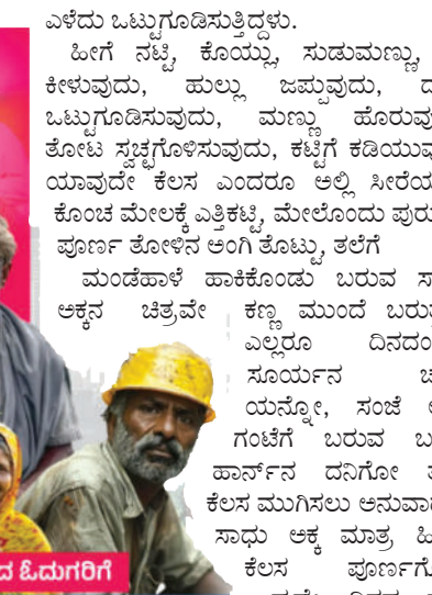
ಸಮಸ್ತ 'ಈ ದಿನ'ದ ಓದುಗರಿಗೆ ಕಾರ್ಮಿಕರ ದಿನಾಚರಣೆಯ

ವಿಷಯಾಂಶ : ಆ ವಿಧಿ ಸಾಧ್ಯವಾಗಿಯೇ ಅಂಥದೊಂದು ಅವಕಾಶವನ್ನೇ ನೀಡಲಿಲ್ಲ. ವಿಧಿಯು ಲೆಕ್ಕಾಚಾರವೇ ಬೇರೆ ಇತ್ತೆನಿಸುತ್ತದೆ. ಬದುಕಿನ ಕೊನೆಯ ದಿನಗಳಲ್ಲಿ ಸಾಧಕ ಹಾಸಿಗೆ ಹಿಡಿಯುವಂತೆ ಮಾಡಿ, ತನ್ನ ಅರಿಯದ ಅಕ್ಕ ಸೋಲೊಪ್ಪಿಕೊಳ್ಳುವಂತೆ ಮಾಡಿತ್ತು. ಮೊನ್ನೆ ಮೊನ್ನೆ ಹೋಗಿ ನೋಡಿದ್ದಾಗ ಸಾಧಕನ ಎಂದಿನ ನಗು ಮಾಸಿತ್ತು, ದೇಹ ಬಳಲಿತ್ತು, ಕೈಗಳು ಸೋಲಿತ್ತುವು, ನೋಟದಲ್ಲಿ ಆಸಹಾಯಕತೆ ಮಡುಗಟ್ಟಿತ್ತು. ಆಕೆ ಸಿಂವಂತೆಯಾಗಲಿಲ್ಲ, ಯಾವುದೇ ಹುದ್ದೆ ಗಳಿಸಲಿಲ್ಲ. ಯಜಮಾನಿಕೆಯ ಅಪಮುಕ್ತಿಯನ್ನು ಎಂದೂ ತೋರಲಿಲ್ಲ. ಆದರೆ ಆಕೆ ನಮ್ಮೊಂದಿಗೆ ತಾಯಿ ಮನಸಿನ ಹಂಗು. ನಮ್ಮ ನೆರವಿನಿಂದಲೇ ಆದ ಸಾಧು ಅಕ್ಕನನ್ನು ನಾವು ಚಿಕ್ಕಂದಿನಿಂದಲೂ ಕೆಲಸಕ್ಕೆ ಬರುವ ಹಂಗುಗಳಿಗೆ ನೋಡುತ್ತಲೇ ಬೆಳೆದವರು. ಹಾಗೆಯೇ ಅದೇಷ್ಟೋ ಮನೆ-ಮನಸುಗಳಿಗೆ ಹತ್ತಿರವಾದವರು. ಅದು ನಮ್ಮ ಮನೆ, ನಮ್ಮ ಊರಷ್ಟೇ ಅಲ್ಲ, ಸುತ್ತಮುತ್ತಲಿನ ಹಳ್ಳಿಗಳಲ್ಲೆಲ್ಲಾ ಆಕೆ ಮಾಡಿದ ಕೆಲಸದ ಬೆವರ ಹನಿಯು ಫಲವಿಲ್ಲ. ಬಿಸಿದ ಶ್ರಮದ ಕಾವು ಅಡಗಿದೆ. ಆ ಮಟ್ಟಿಗೆ ಆಕೆ ಜೀವನಪೂರ್ತಿ ಕೆಲಸ ಮಾಡುತ್ತಲೇ ತನ್ನ ಜೀವವನ್ನು ತೆಲೆದವಳು.