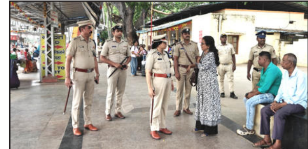
ತ್ರಿಧಿ. ಆದರೂ ಕೆಲ ಸಂದರ್ಭದಲ್ಲಿ ಅವರಾದಿ ಕೃತ್ಯಗಳು ಹಾಗೂ ಅವಘಡಗಳು ಸಂಭವಿಸುತ್ತಿದ್ದು ಈ ನಿಟ್ಟಿನಲ್ಲಿ ರೈಲು ಪ್ರಯಾಣಿಕರು ಸಹ ಜಾಗೃತಿ ವಹಿಸುವ ಮೂಲಕ ರೈಲ್ವೆ ಪೊಲೀಸರಿಗೆ ಸಹಕಾರ ನೀಡುವಂತೆ ಅವರು ಮನವಿ ಮಾಡಿದರು. ರೈಲು ನಿಲ್ದಾಣ ಹಾಗೂ ರೈಲ್ವೆ ಇಲಾಖೆ ವ್ಯಾಪ್ತಿಗೆ ಬರುವ ಪ್ರದೇಶ 'ದ್ರೋಣ' ಅಪಘಾತ ಸಂಭವಿಸಿ ಯಾರಾದರೂ ಸಂಕಷ್ಟ ಸಿಲುಕಿದರೆ ಅಂಥವರ ನೆರವಿಗೆ ಧಾರ್ಮಿಕ ಮನಸ್ಸಿನಿಂದ ಪ್ರತಿಯೊಬ್ಬರೂ ಬೆಳೆಸಿಕೊಳ್ಳುವ ಮೂಲಕ ಮಾನವೀಯತೆ ಮೆರೆಯಬೇಕು ಎಂದು ಕರೆ ನೀಡಿದರು. ಇದೇ ಸಂದರ್ಭದಲ್ಲಿ ರೈಲ್ವೆ ಪೊಲೀಸರು ಪ್ರಯಾಣಿಕರೊಂದಿಗೆ ಸೌಜನ್ಯದಿಂದ ನಡವಿಕೊಳ್ಳಬೇಕು ಅಂದ ನೋಂದಣಿ ನಲುವಿಗೆ ಸ್ಪಂದಿಸುವ ಮೂಲಕ ರೈಲ್ವೆ ಪೊಲೀಸರು ಪ್ರಯಾಣಿಕರ ಸ್ನೇಹಿತರು ಪೊಲೀಸರು ಎಂಬಂತೆ ನಡೆದು ಕೊಳ್ಳುವಂತೆ ಅವರು ಕಿವಿ ಮಾತು ಹೇಳಿದರು. ಈ ಸಂದರ್ಭದಲ್ಲಿ ಸ್ಥಳೀಯ ರೈಲ್ವೆ ಪೊಲೀಸರ ಹಿರಿಯ ಅಧಿಕಾರಿಗಳು ಮತ್ತು ಸಿಬ್ಬಂದಿ ಉಪಸ್ಥಿತರಿದ್ದರು.