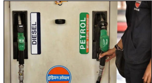
ಲಾಗಿದೆ. ನಿಯಮ ಉಲ್ಲಂಘಿಸಿದರೆ ಕಠಿಣ ಕಾನೂನು ಕ್ರಮ ಕೈಗೊಳ್ಳುವುದಾಗಿ ಸರ್ಕಾರ ಎಚ್ಚರಿಕೆ ನೀಡಿದೆ. ಕೃಷಿ ಚಟುವಟಿಕೆಗಳಿಗೆ ಯಾವುದೇ ತೊಂದರೆ ಆಗದಂತೆ ರೈತರಿಗೆ ಆಗತ್ಯ ಪ್ರಮಾಣದಲ್ಲಿ ಡೀಸೆಲ್ ಪೂರೈಕೆ ಖಚಿತ ಪಡಿಸಬೇಕು ಎಂದು ಆದೇಶದಲ್ಲಿ ಉಲ್ಲೇಖಿಸಲಾಗಿದೆ. ಜೊತೆಗೆ ಅಧಿಕಾರಿಗಳು ಕಾಲಕಾಲಕ್ಕೆ ಬಂಕ್ ಗಳಲ್ಲಿ ಪರಿಶೀಲನೆ ನಡೆಸಬೇಕು ಹಾಗೂ ಜಿಲ್ಲಾಧಿಕಾರಿಗಳು ಸಂಪೂರ್ಣ ಪ್ರಕ್ರಿಯೆಯನ್ನು ಮನಿಟರ್ ಮಾಡಬೇಕು ಎಂದು ಸೂಚಿಸಲಾಗಿದೆ. ಸರ್ಕಾರದ ಈ ಕ್ರಮ ಇಂಧನ ಕೊರತೆ ತಡೆಗಟ್ಟಲು ಮುನ್ನೆಚ್ಚರಿಕೆ ಕ್ರಮವೇ ಅಥವಾ ಪೂರೈಕೆ ಕಷ್ಟಕರವಾಗಿ ಬಹುದು ಎಂಬುದರ ಮುನ್ನೂ ಚಿಂತೆಯೇ ಎಂದು ತಿಳಿದು ಬಂದಿದೆ.

• ಪ್ರಜ್ಞೋದಯ ವರದಿ ಬೆಂಗಳೂರು: ಪೆಟ್ರೋಲ್ ಹಾಗೂ ಡೀಸೆಲ್ ಲಭ್ಯತೆ ಕುರಿತು ಆತಂಕಗಳು ವ್ಯಕ್ತವಾಗುತ್ತಿರುವ ಬೆನ್ನಲ್ಲೇ ರಾಜ್ಯ ಸರ್ಕಾರ ಇಂಧನ ಮಾರಾಟಕ್ಕೆ ಸಂಬಂಧಿಸಿದಂತೆ ಕಟ್ಟುನಿಟ್ಟಿನ ಹೊಸ ಮಾರ್ಗಸೂಚಿಗಳನ್ನು ಪ್ರಕಟಿಸಿದೆ. ಆಹಾರ ಮತ್ತು ನಾಗರಿಕ ಸರಬರಾಜು ಇಲಾಖೆ ಹೊರಡಿಸಿರುವ ಆದೇಶ ಇದೀಗ ಸಾರ್ವಜನಿಕರು ಹಾಗೂ ಪೆಟ್ರೋಲ್ ಬಂಕ್ ಮಾಲೀಕರಲ್ಲಿ ತೀವ್ರ ಚರ್ಚೆ ಕಾರಣವಾಗಿದೆ. ಪೆಟ್ರೋಲಿಯಂ ನಿರೀಕ್ಷೆ-2022 ಅನ್ನು ಕಡ್ಡಾಯವಾಗಿ ಪಾಲಿಸುವಂತೆ ಸೂಚಿಸಿರುವ ಸರ್ಕಾರ, ರಾಜ್ಯದ ಎಲ್ಲಾ ಚಿಲ್ಲರೆ ಇಂಧನ ಮಾರಾಟ ಕೇಂದ್ರಗಳಿಗೆ ಸ್ಪಷ್ಟ ನಿರ್ದೇಶನ ನೀಡಿದೆ. ವಿಶೇಷವಾಗಿ ಪೆಟ್ರೋಲ್ ಮತ್ತು ಡೀಸೆಲ್ ಅನ್ನು ನಿಗದಿತ ಪ್ರಮಾಣ ಹಾಗೂ ನಿಯಮಗಳಂತೆ ಮಾತ್ರ ಮಾರಾಟ ಮಾಡಬೇಕು ಎಂದು ಕಟ್ಟುನಿಟ್ಟಿನ ವಿಧಿಸಲಾಗಿದೆ. ಜಾಗತಿಕ ಸನ್ನಿವೇಶ, ಇಂಧನ ಸರಬರಾಜಿನ ಅನಿಶ್ಚಿತತೆ ಹಾಗೂ ಕೃತಕ ಅಭಾವ ಸೃಷ್ಟಿಸುವ ಸಾಧ್ಯತೆಗಳ ಬೆನ್ನಲೇ ಸರ್ಕಾರ ಮುನ್ನೆಚ್ಚರಿಕೆ ಕ್ರಮವಾಗಿ ಈ ಮಾರ್ಗಸೂಚಿಗಳನ್ನು ಜಾರಿಗೆ ತಂದಿದೆ ಎನ್ನಲಾಗಿದೆ. ಸಾರ್ವಜನಿಕರಿಗೆ ಇಂಧನ ಕೊರತೆ ಉಂಟಾಗದಂತೆ ಹಾಗೂ ಅನಧಿಕೃತ ದಾಸ್ತಾನು, ದುರುಪಯೋಗ ತಡೆಯುವ ಉದ್ದೇಶದಿಂದ ಈ ಕ್ರಮ ಕೈಗೊಳ್ಳಲಾಗಿದೆ. ಹೊಸ ನಿಯಮಗಳ ಪ್ರಕಾರ ವಾಹನಗಳ ಕಂಟೇನರ್‌ಗಳಿಗೆ ಗರಿಷ್ಠ 20 ಲೀಟರ್ ಮಿತಿ ನಿಗದಿ ಮಾಡಲಾಗಿದೆ.