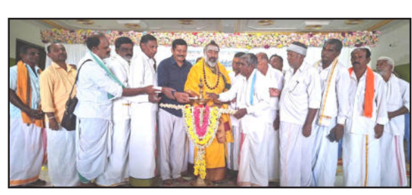
ಯಾವುದೇ ಹಣ ಪಡೆಯದೆ ಪೂಜೆ ಮಾಡುತ್ತಿದ್ದಾರೆ, ಇವರಿಗೆ ಸಂಭಾವನೆ ನೀಡಲು ಸರ್ಕಾರ ಮುಂದಾಗಬೇಕು ಎಂದರು. ಸರ್ಕಾರ ಹಿಂದೂ ದೇವಾಲಯಗಳಲ್ಲಿ ಹುಂಡಿ ಇಟ್ಟಿದೆ. ಆದರೆ ಆ ಹಣವನ್ನು ದೇವಾಲಯ ಅಭಿವೃದ್ಧಿಗೆ ಉಪಯೋಗಿಸಿಕೊಳ್ಳಲು ಸಾಕಷ್ಟು ಕಾನೂನು ತೊಡಕು ಮಾಡುತ್ತಿದೆ. ಇದಾಗಬಾರದು, ಯಾವ ದೇವಾಲಯದಲ್ಲಿ ಹುಂಡಿ ಇದ್ದರೋ ಆ ಹುಂಡಿಯ ಹಣದಿಂದಲೇ ದೇವಾಲಯ ಅಭಿವೃದ್ಧಿಯಾಗಬೇಕು ಇದಕ್ಕೆ ಬದಲಾವಣೆ ತರಬೇಕಾಗಿದೆ ಎಂದು ಅವರು ತಿಳಿಸಿದರು. ನಾಗರಸಮಿತಿ ದೇವಾಲಯವನ್ನು ಗ್ರಾಮಸ್ಥರ ಸಹಕಾರದಲ್ಲಿ ಅಭಿವೃದ್ಧಿ ಮಾಡಿ ಇಂದು ಮಾಸಿಕ ಸಾವಿರಾರು ರೂ. ಅದಾಯ ಬರುತ್ತಿದೆ. ಆದರೆ ಆ ಹಣವನ್ನು ಅಲ್ಲಿನ ಅಭಿವೃದ್ಧಿ ಕೆಲಸಗಳಿಗೆ ಉಪಯೋಗಿಸಿಕೊಳ್ಳಲು ಕಾನೂನು ತೊಡಕು ಮಾಡಲಾಗು