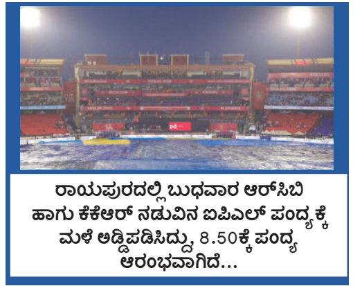
ರಾಯಪುರದಲ್ಲಿ ಬುಧವಾರ ಆರ್‌ಸಿಬಿ ಹಾಗೂ ಕೆಆರ್ ನಡುವಿನ ಐಪಿಎಲ್ ಪಂದ್ಯಕ್ಕೆ ಮಳೆ ಅಡ್ಡಿಪಡಿಸಿದ್ದು, 8.50ಕ್ಕೆ ಪಂದ್ಯ ಆರಂಭವಾಗಿದೆ...

14 ಮೇ 2026 ಗುರುವಾರ ಬೆಲೆ ₹ 2.00 ಸಂಪುಟ : 20 ಸಂಚಿಕೆ : 64 ಪುಟ-4 ಹಾಸನ E-mail : prajodayahsn@gmail.com RNI NO: KARKAN/2007/22629