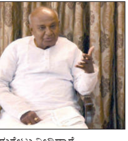
ತಿರುಗೇಟು ನೀಡಿದ್ದಾರೆ. ರೈತರ ಜಮೀನನ್ನು ಬಲವಂತ

ಪ್ರಜೋದಯ ವರದಿ ಬೆಂಗಳೂರು: ಬಿಡದಿ ಟೌನ್ ಶಿಪ್ ಯೋಜನೆ ವಿಚಾರದಲ್ಲಿ ಕೇಂದ್ರ ಸಚಿವ ಹೆಚ್.ಡಿ.ಕುಮಾರಸ್ವಾಮಿ ಹಾಗೂ ಉಪಮುಖ್ಯಮಂತ್ರಿ ಡಿ.ಕೆ. ಶಿವಕುಮಾರ್ ನಡುವೆ ಮುಸುಕಿನ ಗುದ್ದಾಟದೊಡನೆ ಮಧ್ಯಯೋಜನೆ ಮಾಡಿರುವ ಹೆಚ್.ಡಿ.ದೇವೇಗೌಡ ಅವರು ಮುಖ್ಯಮಂತ್ರಿ ಸಿದ್ದರಾಮಯ್ಯ ಅವರಿಗೆ ಪತ್ರ ಬರೆದು ಅಚ್ಚರಿ ಮೂಡಿಸಿದ್ದಾರೆ.