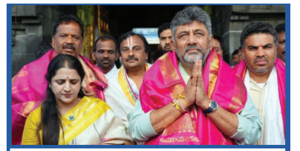
ಉಪಮುಖ್ಯ ಮಂತ್ರಿ ಡಿ.ಕೆ.ಶಿವಕುಮಾರ್ ಅವರು ಮಂಗಳವಾರ ಬೆಳಿಗ್ಗೆ ಪತ್ರಿಕೆ ಸಮೀಪದಲ್ಲಿ ತಿರುಪತಿ ತಿಮ್ಮಪ್ಪನ ದರ್ಶನ ಪಡೆದರು.

20 ಮೇ, 2026 ಬುಧವಾರ ಬೆಲೆ ₹ 2.00 ಸಂಪುಟ : 20 ಸಂಚಿಕೆ : 70 ಪುಟ-4 ಹಾಸನ E-mail : prajadayahsn@gmail.com RNI NO: KARKAN/2007/22629