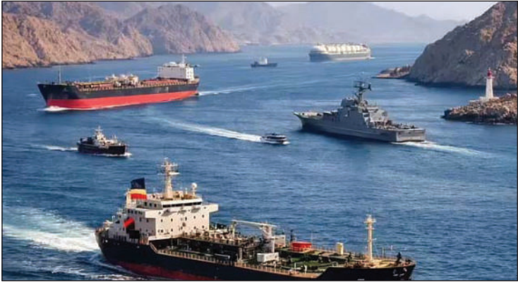
ಹೊರ್ಮುಜ್ ಜಲಸಂಧಿಯಲ್ಲಿ ಸಾಗಾಣಿಕೆಗಾಗಿ ಸಾಗುತ್ತಿರುವ ಹೊರ್ಮುಜ್ ಜಲಸಂಧಿಯ ಮೇಲೆ ಇರಾನ್ ನಿಯಂತ್ರಣವನ್ನು ಕೋರಲಾಗಿದೆ.

ಟೆಹ್ರಾನ್: ಅಮೇರಿಕಾ ಅಧ್ಯಕ್ಷ ಡೋನಾಲ್ಡ್ ಟ್ರಂಪ್ ಅವರ ನಿರಂತರ ಮಿಲಿಟರಿ ದಾಳಿ ಬೆದರಿಕೆಗಳ ನಡುವೆ ಇರಾನ್ ಹೊರ್ಮುಜ್ ಮೇಲೆ ಮತ್ತಷ್ಟು ಹಿಡಿತ ಸಾಧಿಸಲು ಹೊಸದಾಗಿ ರಚಿಸಲಾದ ಔಪಚಾರಿಕ ಗೆಲ್ ಜಲಸಂಧಿ ಪ್ರಾಧಿಕಾರ (ಜಿಪಿಎಸ್) ಜಲಸಂಧಿ ನಿರ್ವಹಣಾ ಮೇಲ್ವಿಚಾರಣಾ ಪ್ರದೇಶದ ಗಡಿಗಳನ್ನು ಗುರುತಿಸಿದೆ.