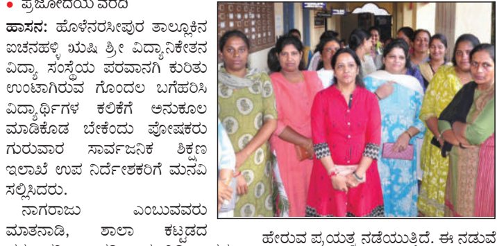
ಯುಜಿಡಿ ಶಾಲೆ ಪರಿವಾಸಿಗಿ ವಿವಾದ: ಪೋಷಕರಿಂದ ಮನವಿ

ಪ್ರಜ್ಞೋದಯ ವರದಿ ಹಾಸನ: ಹೊಳೆನರಸೀಪುರ ತಾಲ್ಲೂಕಿನ ಐಜನಹಳ್ಳಿ ಯುಜಿಡಿ ಶಾಲೆಗೆ ವಿವಾದ ಸೃಷ್ಟಿಯಾಗಿದೆ. ಕುರಿತು ಉಂಟಾಗಿರುವ ಗೊಂದಲ ಬಗ್ಗೆ ಹಿರಿಯ ವಿದ್ಯಾರ್ಥಿಗಳ ಕಲಿಕೆಗೆ ಅನುಕೂಲ ಮಾಡಿಕೊಡ ಬೇಕೆಂದು ಪೋಷಕರು ಗುರುವಾರ ಸಾರ್ವಜನಿಕ ಶಿಕ್ಷಣ ಇಲಾಖೆ ಉಪ ನಿರ್ದೇಶಕರಿಗೆ ಮನವಿ ಸಲ್ಲಿಸಿದರು.