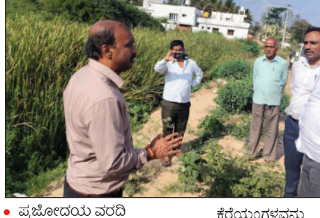
ಕೋಲನಕಟ್ಟೆ ಕೆಲಸ ಅಭಿವೃದ್ಧಿಗೆ ಕ್ರಮ