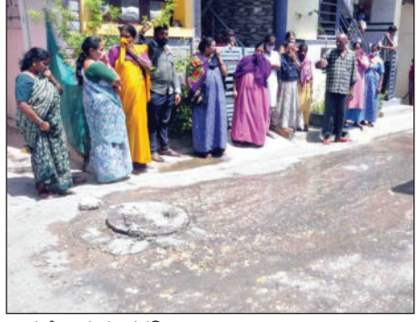
ಬೆನ್ನರ ಬೀದಿಯಲ್ಲಿ ಯುಜಿಡಿ ಸಮಸ್ಯೆ

ಪ್ರಜ್ಞೋದಯ ವರದಿ ಹಾಸನ: ನಗರದ 28ನೇ ವಾರ್ಡ್‌ನ ವಲ್ಲಭಾಯಿ ರಸ್ತೆ ಸಮೀಪದ ಬೆನ್ನರ ಬೀದಿ 1ನೇ ಕ್ರಾಸ್‌ನಲ್ಲಿ ಯುಜಿಡಿ ಕೊಳಚೆ ನೀರು ರಸ್ತೆ ಮೇಲೆ ಹರಿಯುತ್ತಿರುವುದರಿಂದ ಸ್ಥಳೀಯ ನಿವಾಸಿಗಳು ಸಂಕಷ್ಟ ಅನುಭವಿಸುತ್ತಿದ್ದಾರೆ.