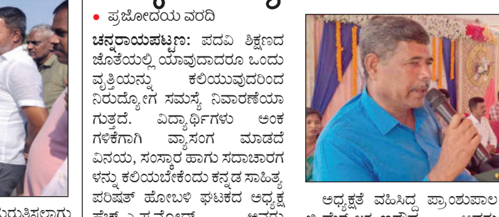
ಮಕ್ಕಳಿಗೆ ವಿದ್ಯೆ ಜೊತೆಗೆ ವಿನಯಕಲಿಕೆಯಾಗಲಿ