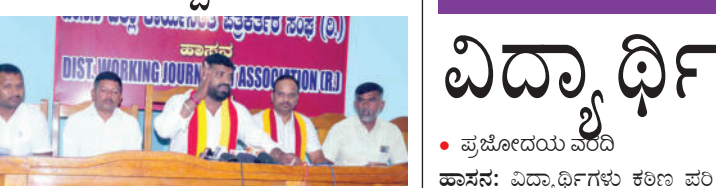
ಸಕಲೇಶಪುರದಲ್ಲಿ ಅರಣ್ಯ ಇಲಾಖೆಯಿಂದ ದಬ್ಬಾಳಿಕೆ: ಆರೋಪ