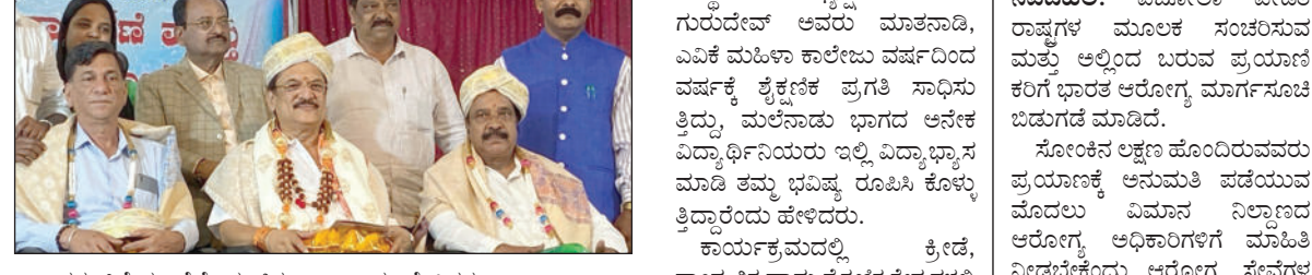
ವಿದ್ಯಾರ್ಥಿ ದೇಸೆಯಲ್ಲಿಯೇ ಸ್ಪಷ್ಟ ಗುರಿ ಹೊಂದಿ