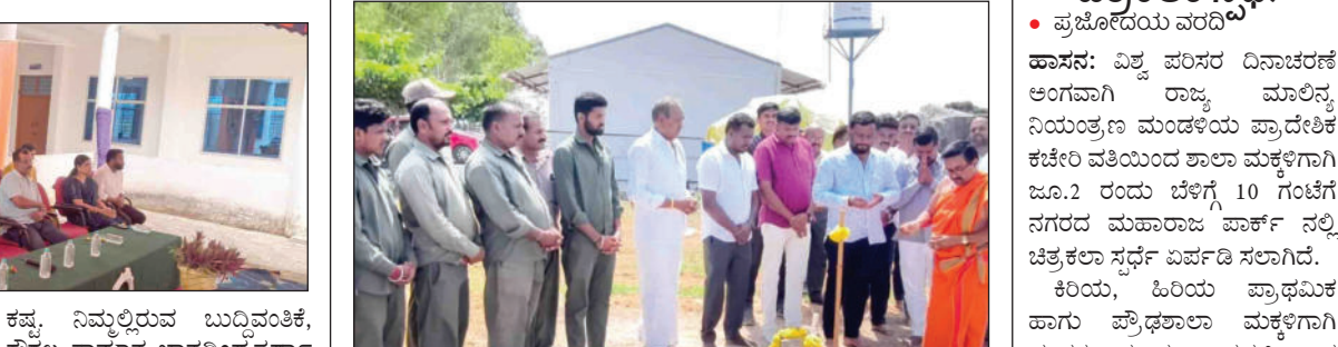
ಅಭಿವೃದ್ಧಿ ಕಾಮಗಾರಿಗೆ ಶಾಸಕ ಚಾಲನೆ

ಪ್ರಜ್ಞೋದಯ ವರದಿ ಹಾಸನ: ತಾಲ್ಲೂಕಿನ ಹೊಳೆನರಸೀಪುರ ತಾಲ್ಲೂಕಿನ ಕೊಡುಗೆಯನ್ನು ಯಾರೂ ಮೀರಿಸಲು ಸಾಧ್ಯವಿಲ್ಲ. ಅವರ ಸೇವೆಯನ್ನು ದೇಶದ ಎಂದಿಗೂ ಮರೆಯುವುದಿಲ್ಲವೆಂದರು.