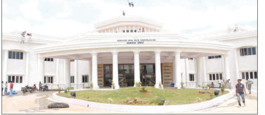
» ವಿಶ್ವವಿದ್ಯಾಲಯಗಳ ಪರಿಣಾ ಕೇಂದ್ರಗಳಲ್ಲಿ ಮಾತ್ರ ತಕ್ಕಮಟ್ಟಿಗೆ ಶಿಷ್ಯ ಮತ್ತು ಪರಿಣಾ ನಿಯಮಗಳನ್ನು ಪಾಲಿಸಲಾಗುತ್ತಿತ್ತು. ಇತರ ಉದ್ಯೋಗ ಎಷ್ಟೋ ಪರಿಣಾ ಕೇಂದ್ರಗಳು ಎಲ್ಲಾ ನಿಯಮ, ಮೌಲ್ಯಗಳನ್ನು ಗಾಳಿಗೆ ತೂರಿ ಪದವಿಗಳನ್ನು ಅಗ್ಗಕ್ಕೆ ಮಾರುವ ಗೂಡಂಗಡಿಗಳಾಗಿದ್ದವು. ಇಲ್ಲಿ ಮೂರು ಹಂತದ ಸುಲಿಗೆ ನಡೆಯುತ್ತಿತ್ತು.

ಮರ್ಚೆಂಟ್ ಎಕ್ಸಿಬಿಷನ್ ಮತ್ತು ಸರ್ಕಸ್ - ನಿವೇಶಿ ಸಾಗರ್