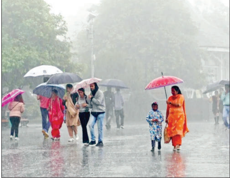
ಮಾಡಿರುವ ದೀರ್ಘಾವಧಿಯ ಮುನ್ಸೂಚನೆಯ ಪ್ರಕಾರ, ಈ ವರ್ಷದ ಮುಂಗಾರು ಋತುವಿನ ಒಟ್ಟು ಮಳೆ ಸರಾಸರಿಗಿಂತ ಸ್ವಲ್ಪ ಕಡಿಮೆ ಇರುವ ಸಾಧ್ಯತೆಯಿದೆ. ಮುಂಗಾರು ಋತುವಿನ ಒಟ್ಟು ಮಳೆ ದೀರ್ಘಾವಧಿಯ ಸರಾಸರಿ ಶೇ.92 ರಷ್ಟು ಇರಲಿದೆ ಎಂದು ನಿರೀಕ್ಷಿಸಲಾಗಿದೆ. ವಿಶ್ವಾಸ್ಯ ಮಹಾಸಾಗರದಲ್ಲಿ ಎಲ್ ನೀನೋ ವಿದ್ಯಾತ್ಮಾನ ಮತ್ತು ಹಿಂದೂ ಮಹಾಸಾಗರದಲ್ಲಿ ದ್ವಿಧ್ರುವಿ ಪ್ರಕ್ರಿಯೆಯು ಮುಂಗಾರು ಮಾರು

• ಪ್ರಜ್ಞೋದಯ ವರದಿ ಬೆಂಗಳೂರು: ದೇಶದ ಕೃಷಿ ಕ್ಷೇತ್ರದ ಜೀವನಾಡಿಯಾದ ನೈಋತ್ಯ ಮುಂಗಾರು ಆಗಮನದ ಕುರಿತು ಭಾರತೀಯ ಹವಾಮಾನ ಇಲಾಖೆ ಮಹತ್ವದ ಅಧಿಕೃತ ಮುನ್ಸೂಚನೆ ನೀಡಿದೆ. ಈ ವರ್ಷದ ಮುಂಗಾರು ಜೂನ್ 5ರ ಸುಮಾರಿಗೆ ಕರ್ನಾಟಕಕ್ಕೆ ಅಧಿಕೃತವಾಗಿ ಆಗಮಿಸಲಿದೆ ಎಂದು ಹವಾಮಾನಶಾಸ್ತ್ರಜ್ಞರು ಸ್ಪಷ್ಟಪಡಿಸಿದ್ದಾರೆ. ಕೇರಳದ ಅನೇಕ ಭಾಗಗಳು ಮತ್ತು ಅರಬ್ಬಿ ಸಮುದ್ರದ ದಕ್ಷಿಣ ಪ್ರದೇಶದಲ್ಲಿ ಮುಂಗಾರು ಮಳೆಯ ಚಲನೆ ಈಗಾಗಲೇ ಪರಿಭ್ರಮಿಸಿ ಅನುಕೂಲಕರವಾಗಿವೆ ಮತ್ತು ರಾಜ್ಯದಲ್ಲಿ ಮಳೆ ನೀರಾವರಿ ನಿಗದಿಯಂತೆ ಪ್ರಾರಂಭವಾಗಿದೆ. ಈ ನಿಟ್ಟಿನಲ್ಲಿ ದಕ್ಷಿಣ ಕನ್ನಡ, ಉಡುಪಿ ಮತ್ತು ಉತ್ತರ ಕನ್ನಡದ ಕರಾವಳಿ ಜಿಲ್ಲೆಗಳಲ್ಲಿ ಮುನ್ನೆಚ್ಚರಿಕೆ ಕ್ರಮಗಳನ್ನು ತೆಗೆದುಕೊಳ್ಳಲಾಗುತ್ತಿದೆ. ಕಳೆದ ಕೆಲವು ವಾರಗಳಿಂದ ರಾಜ್ಯದ ವಿವಿಧ ಜಿಲ್ಲೆಗಳಲ್ಲಿ ಭಾರೀ ಮಳೆಯಾಗುತ್ತಿರುವುದರಿಂದ ಮಣ್ಣಿನ ತೇವಾಂಶ ಹೆಚ್ಚಾಗಿದೆ. ವಿಶೇಷವಾಗಿ ಕಲ್ಯಾಣಿ ಕರ್ನಾಟಕ ಮತ್ತು ಮಧ್ಯ ಕರ್ನಾಟಕದ ಜಿಲ್ಲೆಗಳಲ್ಲಿ, ಭಾರಿ ಮಳೆಯು ಕೃಷಿ ಕೆಲಸಕ್ಕೆ ಉತ್ತಮ ಆರಂಭವನ್ನು ನೀಡಿದೆ. ಹವಾಮಾನ ಇಲಾಖೆಯ ಬೆಂಗಳೂರು ಕೇಂದ್ರದ ತಜ್ಞರ ಪ್ರಕಾರ, ಮುಂಗಾರು ಆರಂಭದ ಹಂತದಲ್ಲಿ ಕರಾವಳಿ ಮತ್ತು ಮಲೆನಾಡು ಜಿಲ್ಲೆಗಳಲ್ಲಿ ಉತ್ತಮ ಮಳೆಯನ್ನು ತರುತ್ತದೆ ಮತ್ತು ನಂತರ ಒಳನಾಡಿನ ಕಡೆಗೆ ಚಲಿಸುತ್ತದೆ. ಭಾರತೀಯ ಹವಾಮಾನ ಇಲಾಖೆ ಬಿಡುಗಡೆ