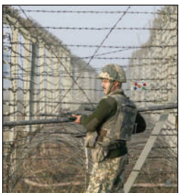
ಮೂಲಕ ದಾಳಿ ನಡೆಸಲು ತೆಗೆದುಕೊಂಡಿದ್ದ ಪಾಕಿಸ್ತಾನದ ಸೇನಾ ಚೌಕೋದ್ದೇಶದ ಘರಾಟದ ಮೇಲಿನ ಆತ್ಮಹುತಿ ಬಾಂಬ್ ದಾಳಿ ಯಶಸ್ವಿ ಭದ್ರತಾ ಪಡೆಗಳು ಮಂಗಳವಾರ ವಿಫಲಗೊಳಿಸಿ, ನಾಲ್ವರು ಉಗ್ರರನ್ನು ಹತ್ಯೆ ಮಾಡಿತು.